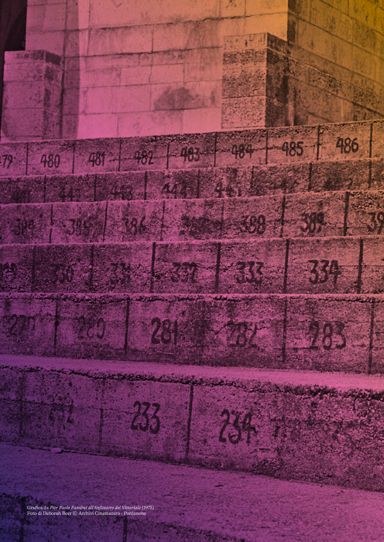
Grafica da Pier Paolo Pasolini all'Anfiteatro del Vittoriale (1975)